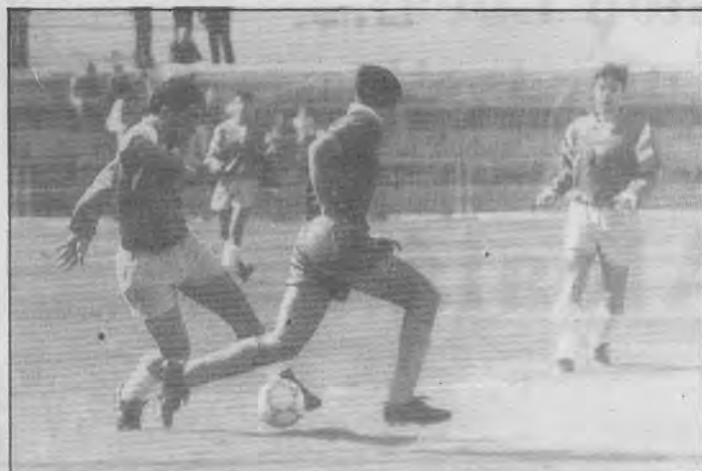
Abades empujó al equipo desde atrás ante la atenta mirada de Vega, de los más acertados.

El presidente del Alcalá y otros directivos no quisieron estar con el equipo en P. Cazalla y se marcharon a Utrera para ver ese partido