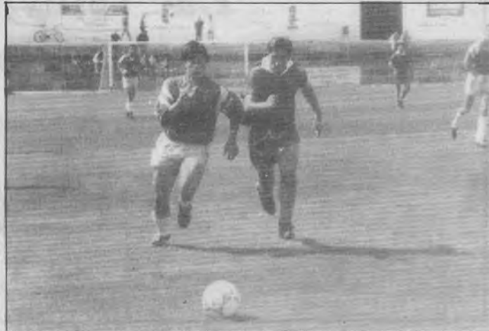
El joven Garrido y Carlos pugnan por la pelota en un partido de claro color alcalareño.