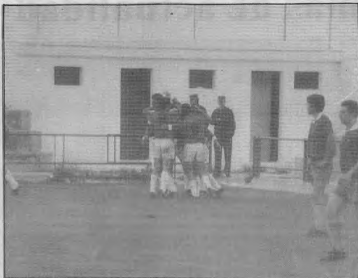
Los abrazos de los jugadores alcalareños tras el segundo gol no servirían para mucho.

Tal y como se esperaba el C.D. Alcalá logró vencer y convencer an-